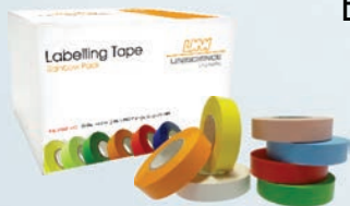
Caixa de Fitas de Identificação Coloridas

Etiquetas e Fitas adesivas para Laboratório