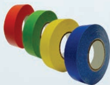
Fita de Identificação