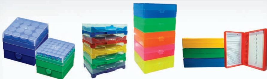
Racks e Caixas de Armazenamento