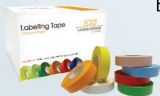
Caixa de Fitas de Identificação Coloridas

Etiquetas e Fitas adesivas para Laboratório