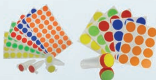
Etiqueta Adesiva Redonda em Folhas