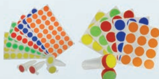
Etiqueta Adesiva Redonda em Folhas